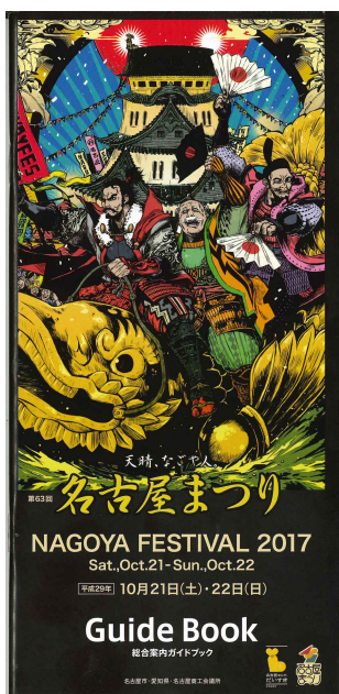
(公式ガイドブック)