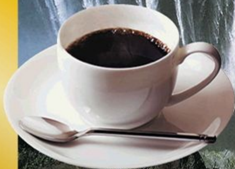
写真:世界三大瀑布の一つヴィクトリアの滝