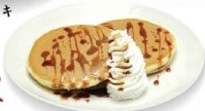
黒糖ホットケーキ