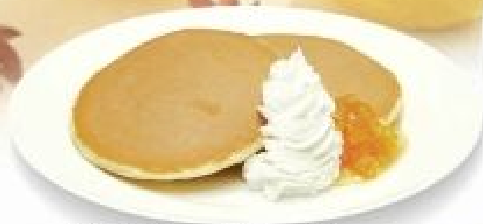
柚子ホットケーキ