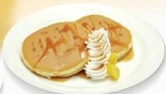
マロンホットケーキ